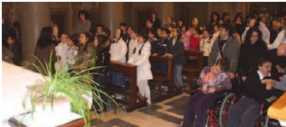
Santuario del SS. Crocifisso: "Giornata di solidarietà". Celebrazione S. Messa

La nostra esperienza è iniziata circa un anno fa, ed è stata frutto di un progetto teatrale tra l'associazione Ephedra e la Lega del Filo d'Oro. Tra le varie attività svolte dai ragazzi della Lega il teatro ha una rilevanza particolare, abbiamo perciò colto l'occasione di presentare loro "il musical".