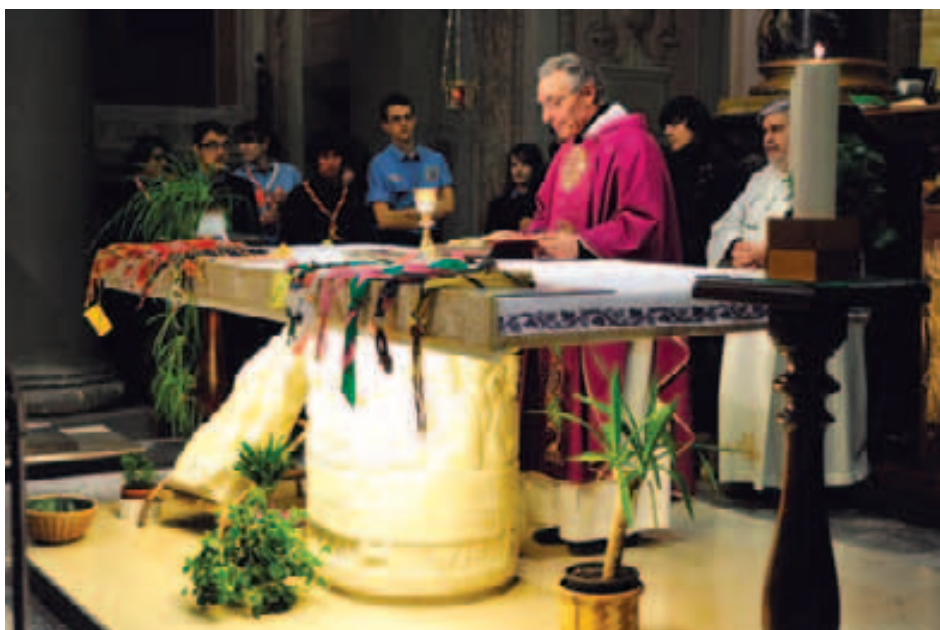
Santuario del SS. Crocifisso: raduno Scout zona di Macerata