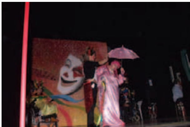
Teatro Apollo: spettacolo "Il Circo" ad opera dei ragazzi della Lega del Filo d'Oro