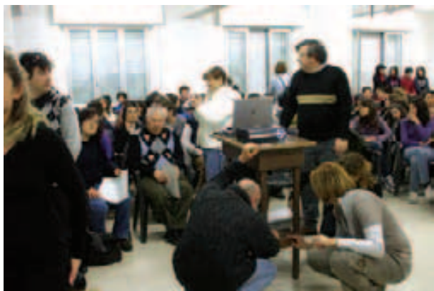
Scuola media: incontro con la Lega del Filo d'Oro