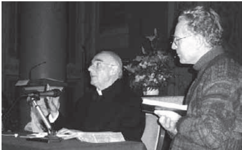
Santuario del SS. Crocifisso: mons. Arcivescovo Luigi Conti

questo non è più un crocifisso: le braccia non sono più allargate sulla croce, vedete già un Crocifisso Risorto, che con i segni della passione, vive immortale. Contemplatelo bene, perché è una grande fortuna avere questo tipo di icona e si comprende come qui la devozione popolare non sia mai cessata fin dall'inizio.