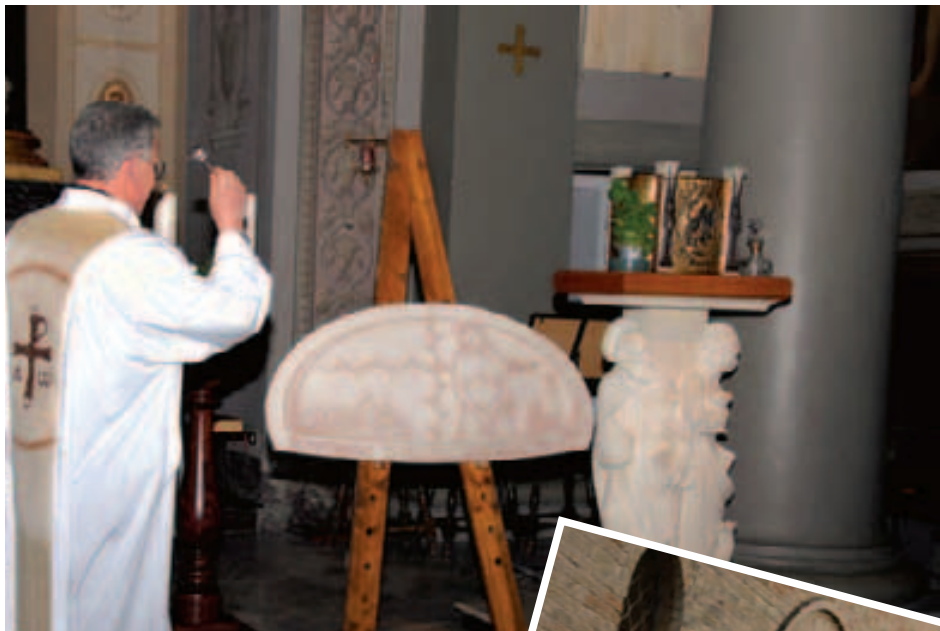
Santuario del SS. Crocifisso: benedizione dei pannelli stradali