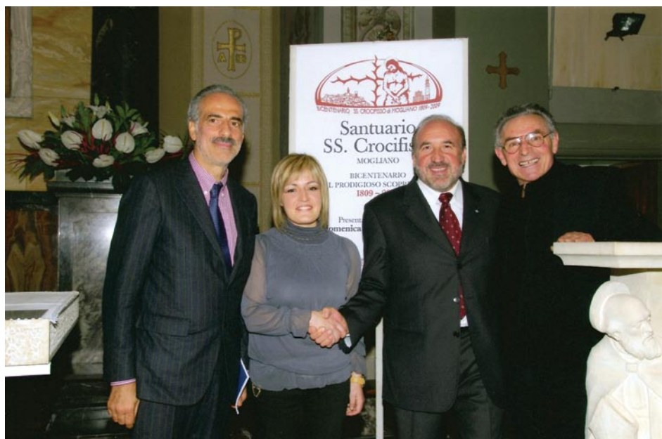
Il saluto delle autorità alla vincitrice del concorso per il logo