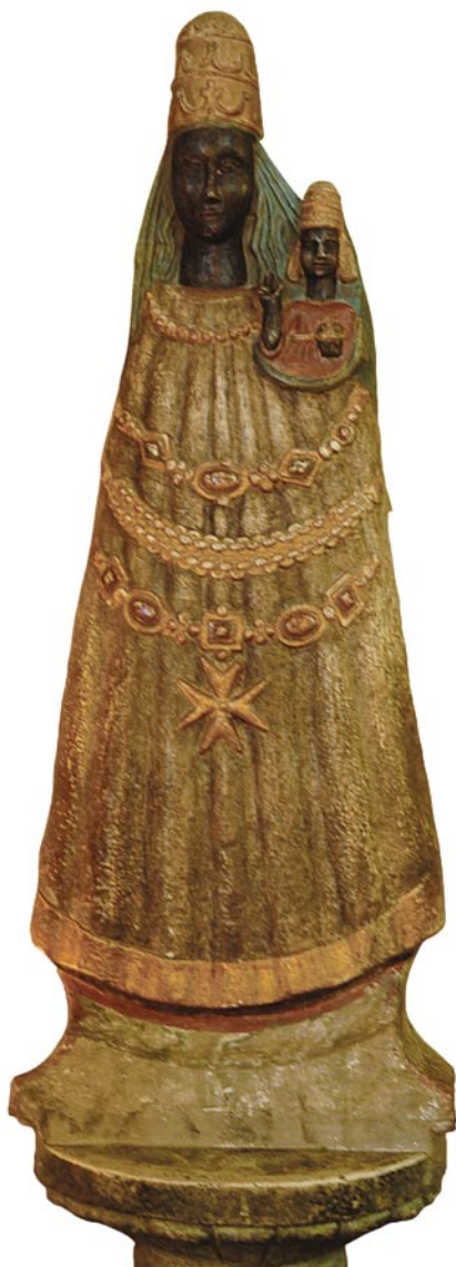
Santuario del Crocifisso, statua in pietra policroma della Madonna di Loreto

La prima notizia di questa statua l'abbiamo da un inventario della confraternita della Pietà, che aveva costruito la chiesa e della quale era responsabile, perché l'icona era collocata in una nicchia