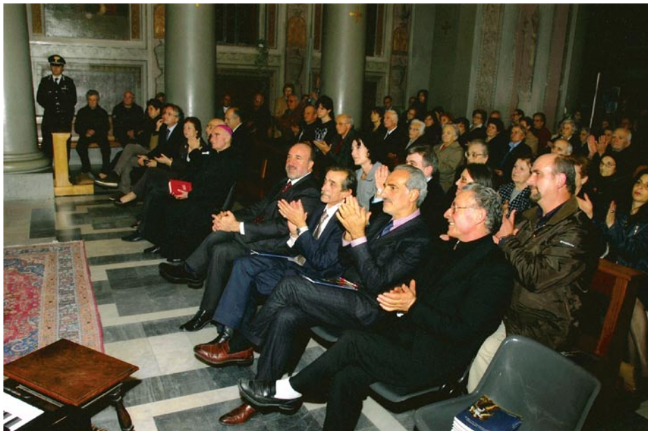
Santuario del Crocifisso, cerimonia della solenne apertura del Bicentenario