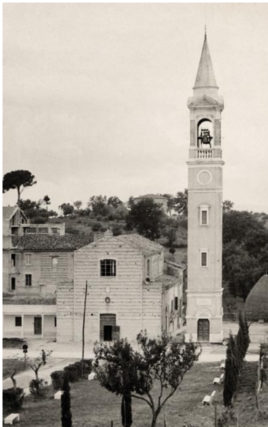
Santuario del Crocifisso, foto del 1955

volgere al meglio certe situazioni difficili.