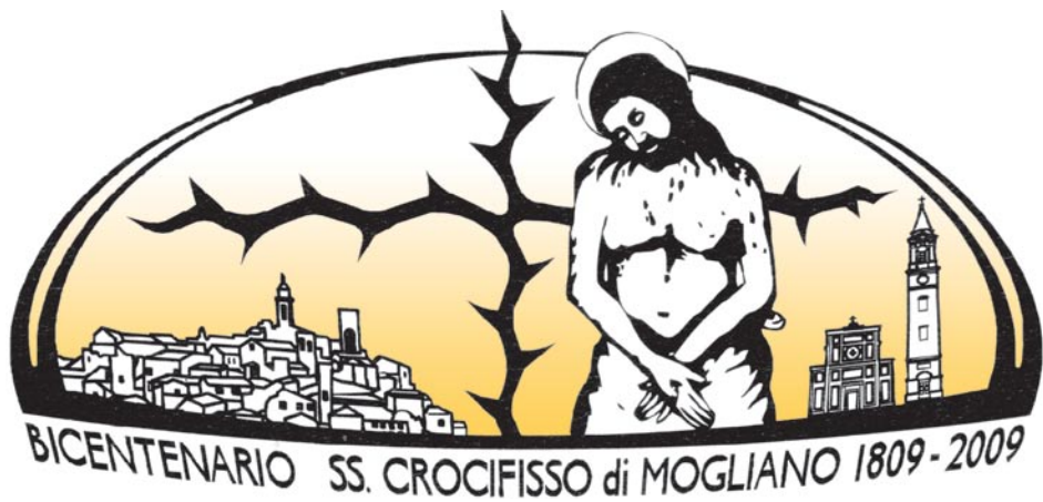
Logo del Bicentenario